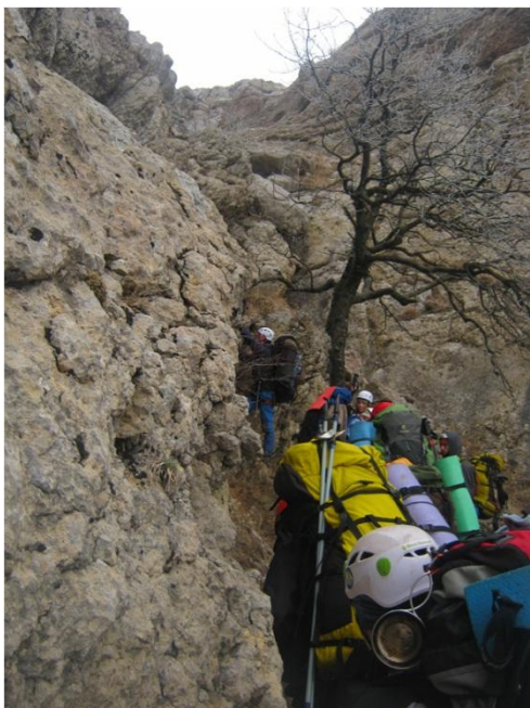
Фото 4 – Подолання сходинки